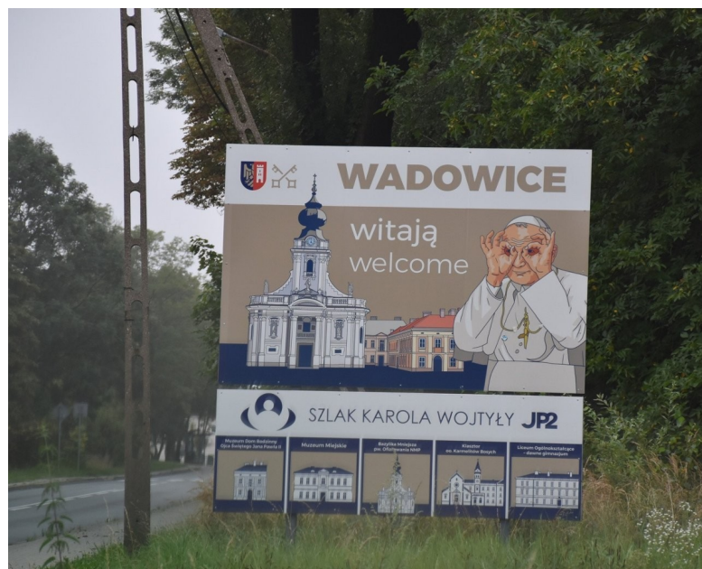
Abb. 2 rechts : Ortseingang von Wadowice, Geburtsort des polnischen Papstes. Links : Das Sternchen besagt, dass die Namensform nirgendwo vorliegt, sondern sprachwissenschaftlich erschlossen ist.

Links sehen wir einige Dorfnamen vom Typ Waddeweitz . Für Wittfeitzen und Vietze setzt Kühnel einen slawischen Gründer voraus, der vielleicht Viteslav oder Vitomer hieß. Der